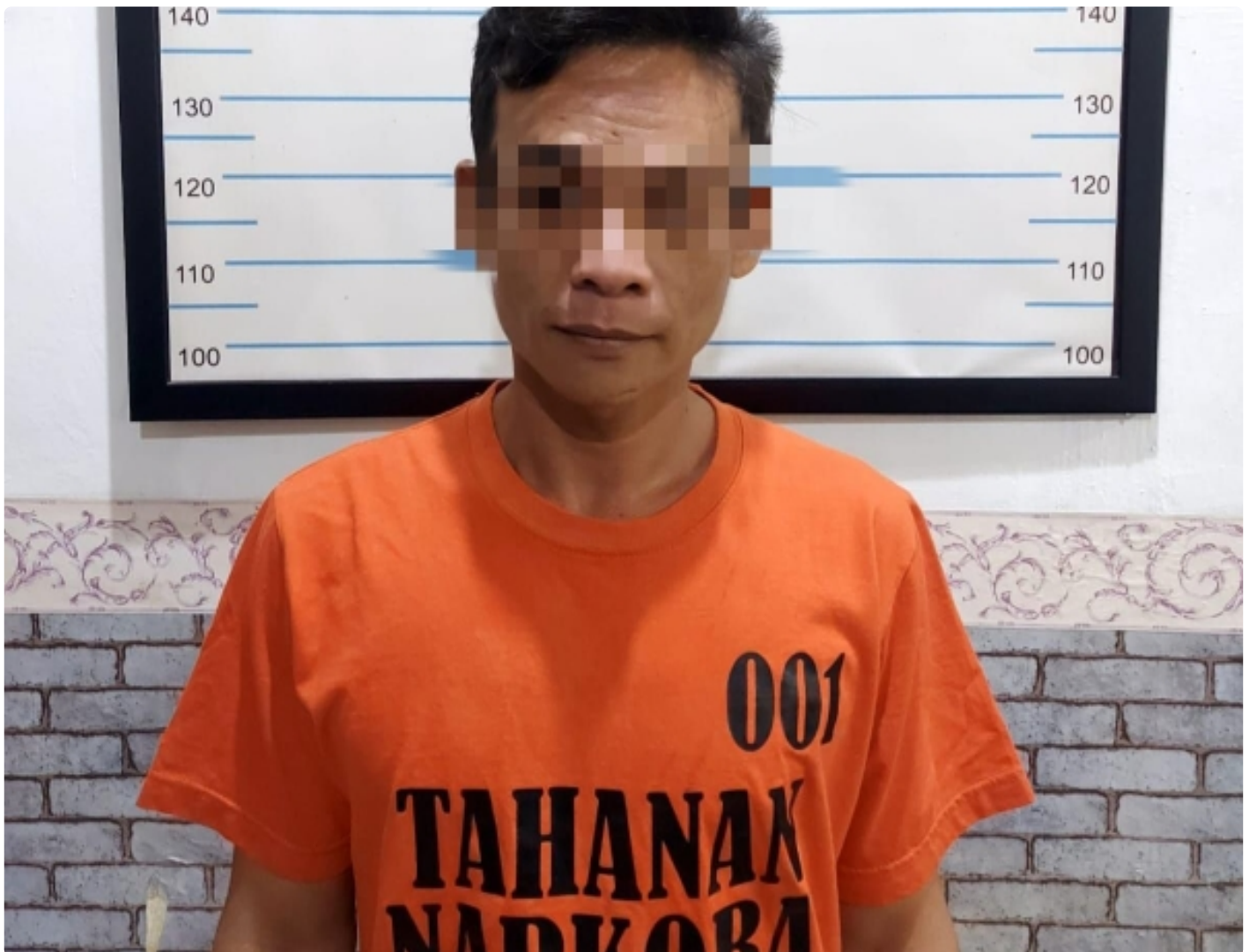
Tersangka SY Diamankan Satnarkoba Polres HST beserta Barang Bukti

Polres Hulu Sungai Tengah Polda Kalimantan Selatan - Satuan Resnarkoba HST, berhasil meringkus tersangka SY, 38 Tahun, Laki-laki, Wiraswasta, SMA, Jln. Batuah rt 003 rw 002 Desa Pandawan Kec. Pandawan Kab. HST ( sesuai KTP ) yang diduga sebagai penyalahgunaan narkoba jenis sabu-sabu. Minggu (8/1/2023) skj 22.15 wita